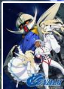
V Gundam (TV 1999)