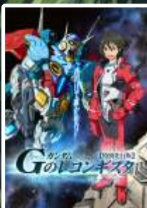
Gundam Reconguista in G (TV 2014, Film 2019)