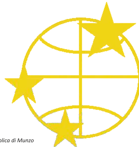
Repubblica di Munzo